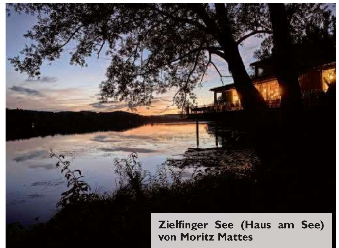
Zielfinger See (Haus am See) von Moritz Mattes