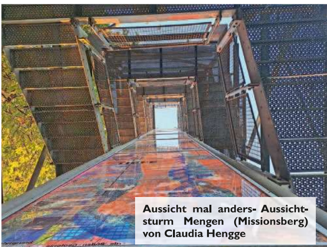
Aussicht mal anders- Aussichtsturm Mengen (Missionsberg) von Claudia Hengge