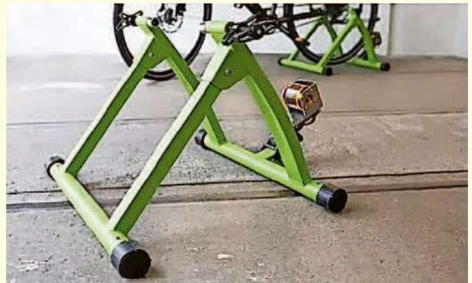
Fotos: der Weihnachtsbaum am Rathaus wird mithilfe sog. Stromfahrräder zum Leuchten gebracht (Stadt Mengen und Beispielbild www.strom-velo.com )

Für Fragen und weitere Informationen steht Ihnen gerne Kerstin Keppler unter Tel.: 0725 72 /607-503 oder per E-Mail unter presse@mengen.de zur Verfügung.