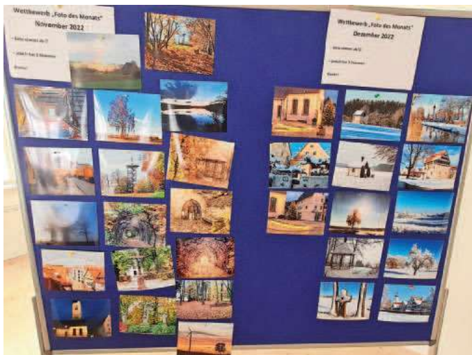
Fotos: Übersicht der (geeigneten) Einsendungen für Oktober bis Dezember (Stadt Mengen)