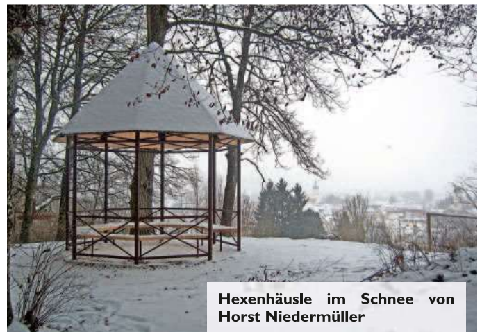
Hexenhäusle im Schnee von Horst Niedermüller