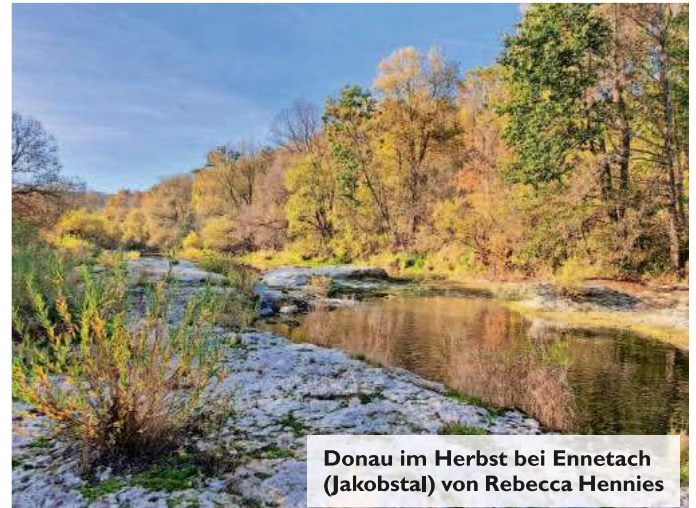
Donau im Herbst bei Ennetach (Jakobstal) von Rebecca Hennies