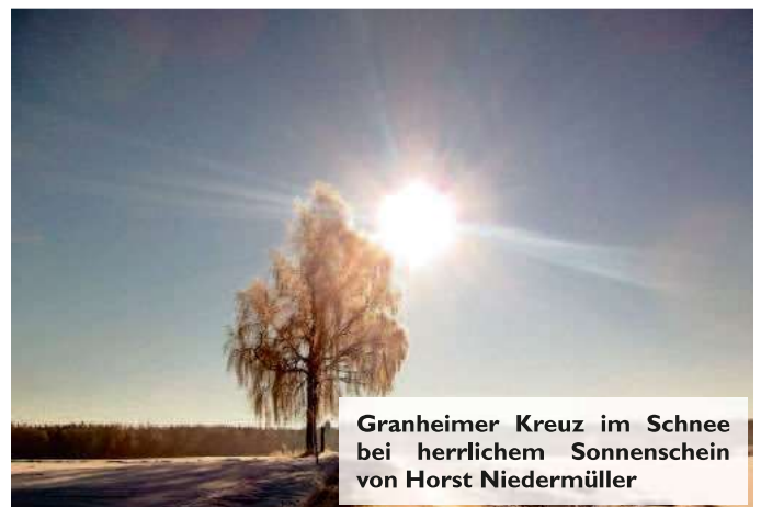
Granheimer Kreuz im Schnee bei herrlichem Sonnenschein von Horst Niedermüller