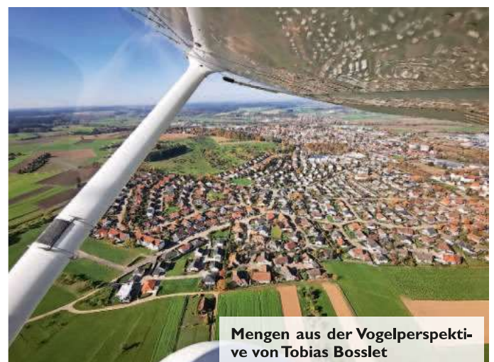
Mengen aus der Vogelperspektive von Tobias Bosslet