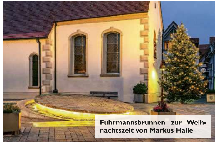
Fuhrmannsbrunnen zur Weihnachtszeit von Markus Haile