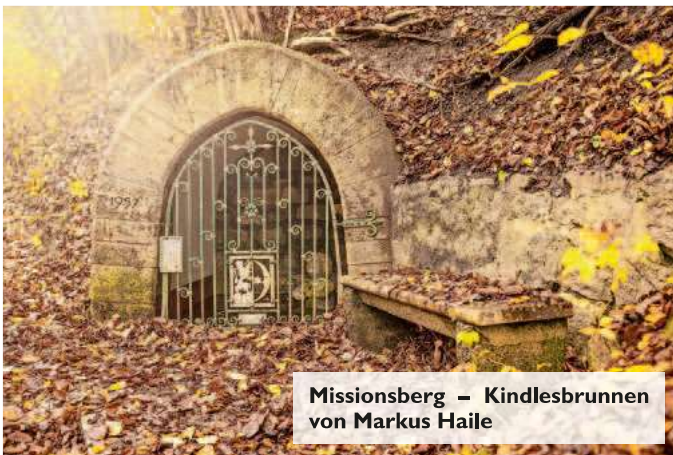
Missionsberg – Kindlesbrunnen von Markus Haile